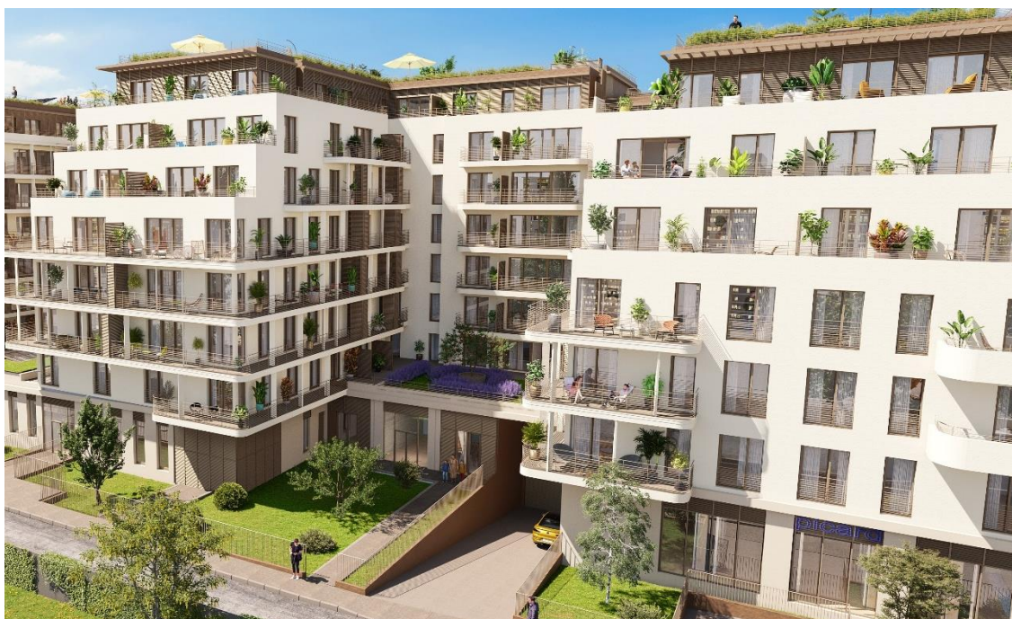
Les Ateliers de Poissy, France (Poissy)

Interconstruction a cédé à PRIMONIAL à Poissy près de Paris, un projet majeur loué à Compose l'opérateur de co-living ainsi qu'un développement de logements pour seniors à COVEA NATIXIS. En outre, la filiale a atteint son objectif de vendre en 2023 485 unités résidentielles en région parisienne, en partie sous forme de ventes en bloc à des investisseurs institutionnels tels que la Caisse des Dépôts et Consignations et en partie sous forme de ventes à l'unité à des acheteurs privés.