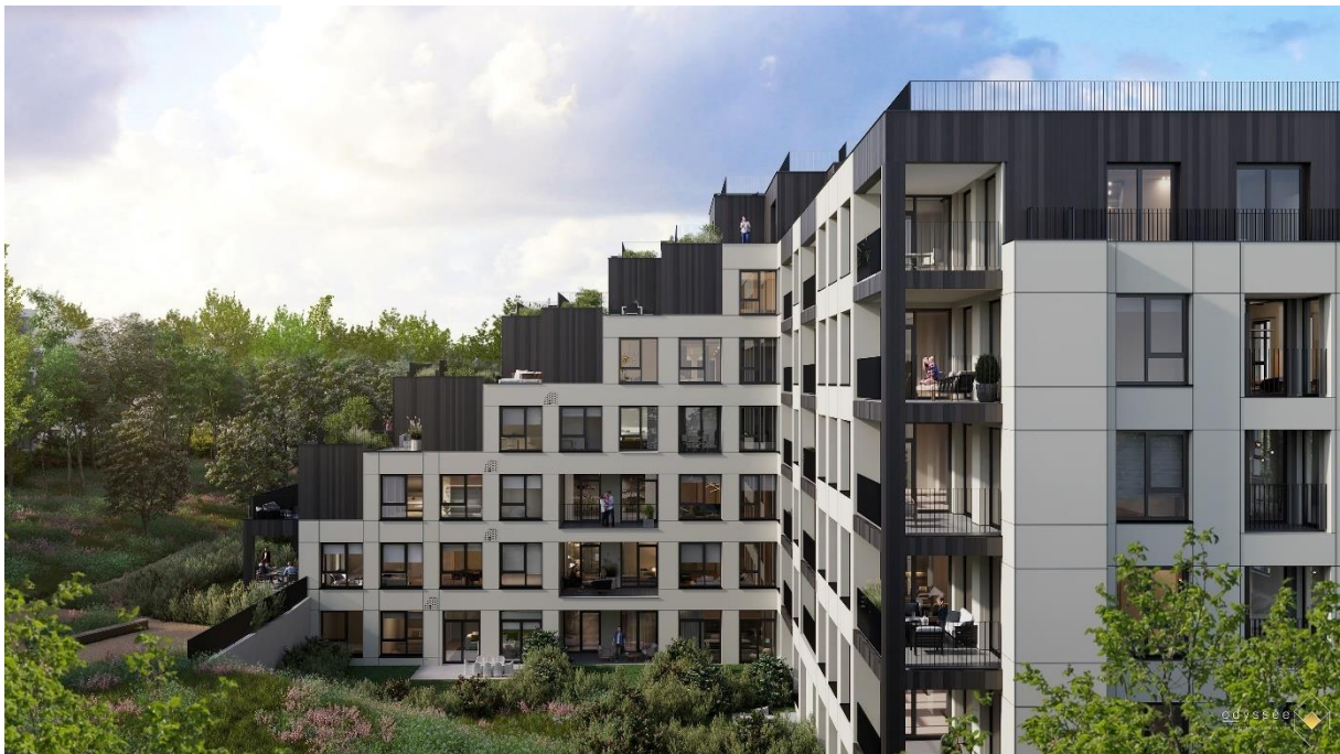
Twin Fall, Belgique (Bruxelles)

Eaglestone Luxembourg a également finalisé la location d'un projet stratégique situé à La Cloche d'Or qui offrira 5.000 m 2 d'espace de bureaux d'une qualité architecturale exceptionnelle et certifié BREEAM Excellent.