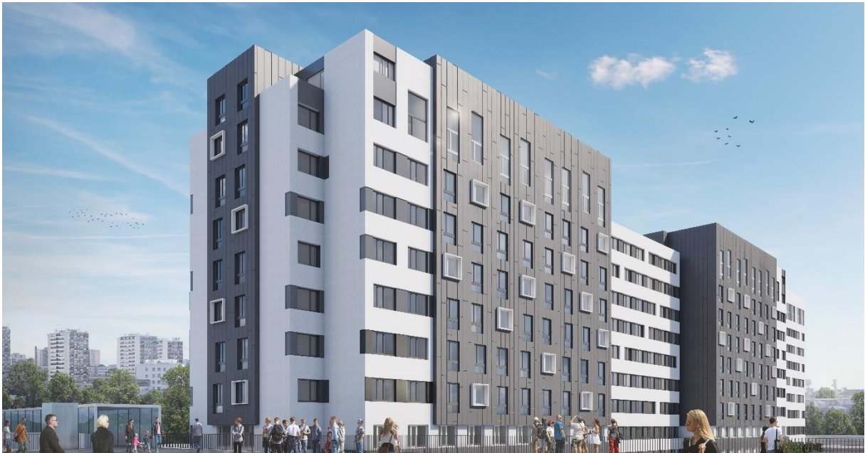
Good Morning Campus, France (Creteil)

Cardinal Promotion a vendu un de ses projets de 570 logements étudiants localisé à Créteil à des investisseurs individuels pour plus de 82 millions d'euros. Cardinal Gestion , 4ème opérateur de logements étudiants en France, génère également des revenus récurrents pour le groupe à travers la gestion de ses 45 résidences étudiantes, atteignant un EBITDA de 7 millions en 2023.